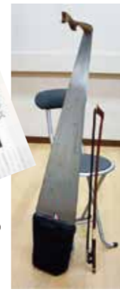
のこぎりはフランス製