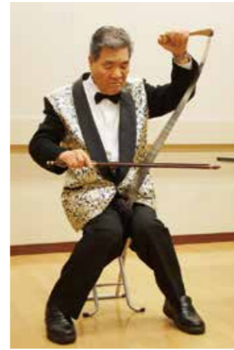
のこぎりの演奏も披露していただきました