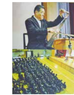
湘江中学校での演奏風景