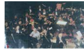
2004年フランスインターナショナルのこぎり演奏大会にゲスト出演