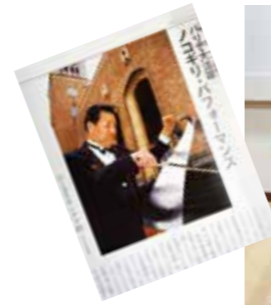
フランス・パリでの活躍を報じる「早稲田学報」2005年