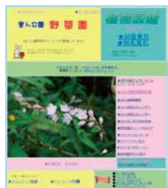
足立で見られる野草も掲載 舎人公園野草園のホームページ。 舎人公園野草ボランティアが管理しています。 http://toneri-yasoen.a.la9.jp/

一時期花粉症の原因植物として誤解されていましたが、本種はミツバチの蜜源植物となる様な虫媒花であり、風で花粉を飛ばす風媒花ではないため花粉の生成量は少なく、現在では本件に対して「無罪」と考えられています。