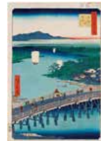
名所江戸百景 千住の太はし

会場：第1回 生涯学習センター 5階 研修室1 第2回 東岳寺・伊興寺町(足立区伊興本町1-5-16) 第3回 足立区立郷土博物館(足立区大谷田5-20-1) 対象：16歳以上の方 定員：50人(抽選) 受講料：2,000円(69歳以下の方は博物館入館料200円が必要です) 申込：往復ハガキ、8/20(月)必着 申込先・お問い合わせは下記をご覧ください。