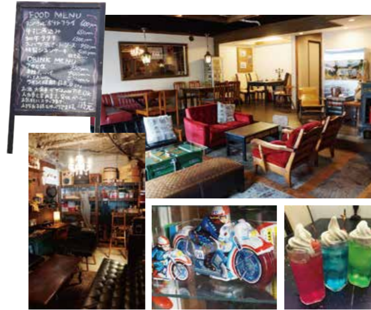
「時元」とは時代を元にもどす。和風回帰。地元の職人さんによって作られた、和モダン、ハイカラな雰囲気の中で非日常的な時間を提供。foods & drinkの多国籍料理や世界のビールもあります。落ち着くガレージを改装した個室、ブリキのおもちゃも売っています。