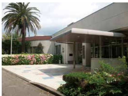
宿泊施設：大房岬自然の家 南房総市富浦町多田良1212-23