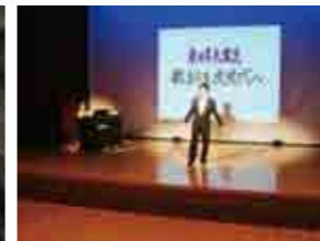
チャリティーコンサート