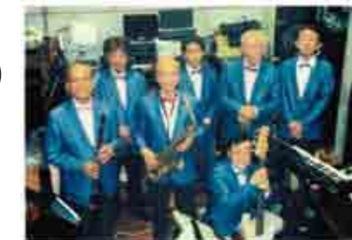
ゲストバンド:マケナイズ

アマチュアのミュージシャンが自慢の腕を音楽好きの皆様にご披露します。ソロありグループあり、癒し系あり情熱系あり。いろんなジャンルの演奏会です。入場無料。音楽好きのご来場をお待ちしております。