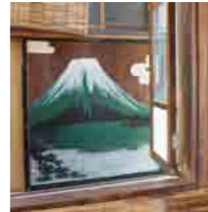
「槍かけだんご」さんからの板張りの襖絵