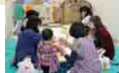
保育ボランティア