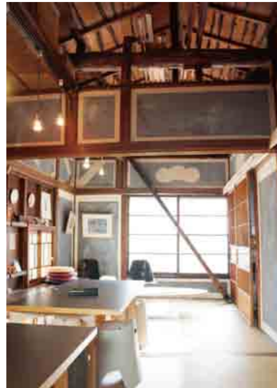
「槍かけだんご」さんからの梯子（奥）が掛かるアトリエ