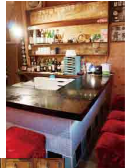
1階カウンターと千住五丁目の「梅の湯」さんからいただいた下駄箱