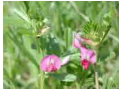
カラスノエンドウ

荒川の土手で食べられる野草を探し、見つけた野草のレシピなどを紹介します。※「学びピアの縁側」は、毎月1回「学びピア21」の各施設がプログラムを持ちよって開催します。