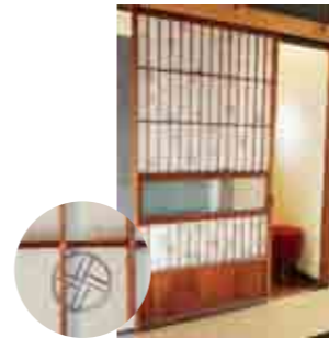
「久保田生花店」さんからの障子