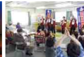
被災地慰問(千葉県旭市)