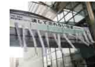
吹き流しの寄せ書き