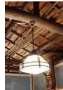
「竹内商店」さんからの照明器具