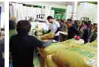
米の放射線検査場見学(福島県町)