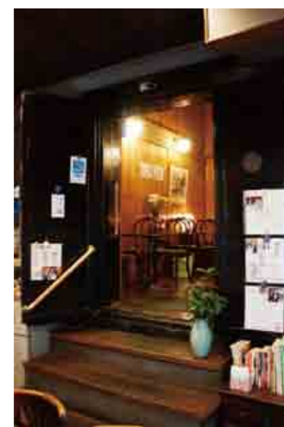
黒漆塗りの鉄扉の奥が喫茶室