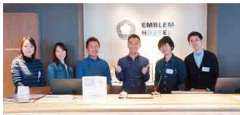
入江氏(右から3人目)とコネクターのみなさん