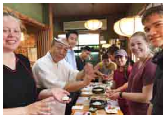
握りずしのワークショップ