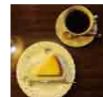
チーズケーキセット 800円