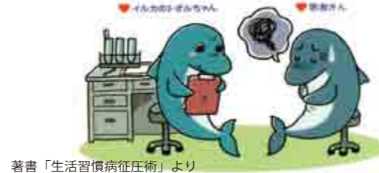
著書「生活習慣病征圧術」より

がんになりにくい生活習慣を行うことで、がんのリスク を下げる事が可能となります。そうすることで、がん だけではなく、生活習慣病になりにくい心と身体を作り 上げることを学びます。