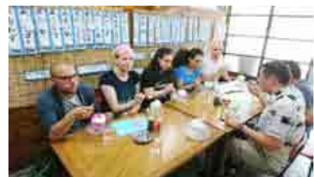
西新井大師ツアーの途中でかき水体験。