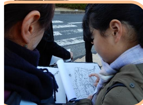
古地図を見ながら昔と今の違いを研究中!