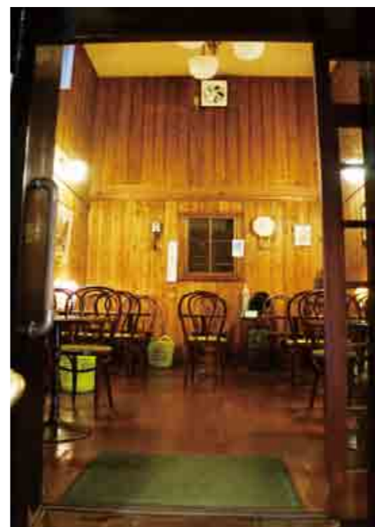
蔵の中の喫茶室。開放感のある高い天井。