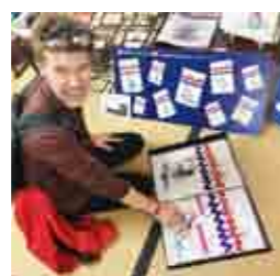
「千住紙のもフェス」に参加。