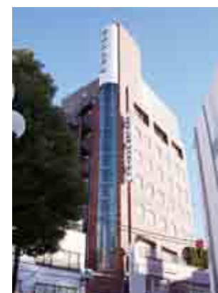
エンブレムホテル西新井 西新井駅から徒歩1分 http://emblemhostel.com

住んでいる人でもなかなか気付かない西新井の魅力。コネクターが旅人たちを生の下町に導きます。