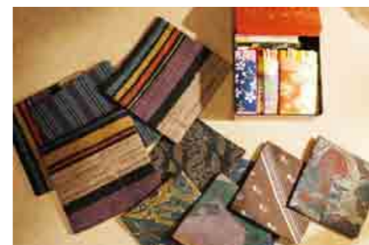
オーナーの手作り、和紙の楊枝入れとネクタイなどを再利用した布製のコースター

千住の旧日光街道沿いには家並みの奥に蔵がいくつか残っています。しかし、なかなか蔵の中を見る機会はありません。元紙問屋横山家の蔵を移築し改装した「千住宿歴史ブチテラス」と今回ご紹介する「喫茶蔵」ぐらいでしょうか。「喫茶蔵」はもともと質蔵で、大正12年(1923)竣工、蔵の外壁に「大倉屋質店」と丸に違い鷹の羽の家紋が見えます。オーナーの母親が営んでいた質屋をリノベーションして喫茶店にしたのが昭和の終わりごろ、かれこれ30年以上たっています。帳場のところがカウンター、蔵の中が喫茶室。アンティークな小物が木の壁と相まってホッとできる空間を演出しています。ゆったりとした時間が流れる蔵の中でコーヒーを飲みながら名物の「鯛焼き」が焼きあがるのをじっくり待つのもいいかもしれませんね。 「喫茶蔵」 足立区千住一丁目34-10 午前10時～午後6時営業 日・祝日休み