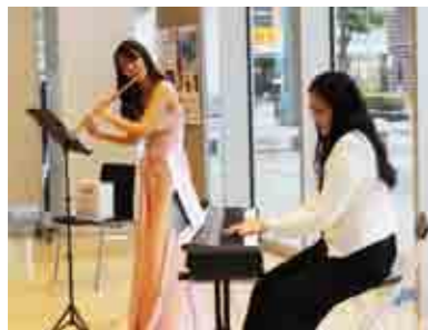
協力/NPO法人おたまじゃくしクラブ