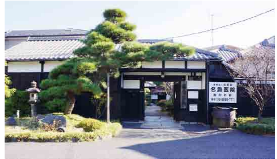
名倉医院の入口の長屋門