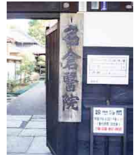
大きな木製の表札

業祖から約250年、千住に今も続く名倉医院。黒く重厚な長屋門が初冬の透明な日の光の中、静かに佇んでいました。