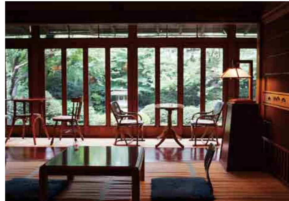
縁側カフェのガラス戸の向こうは四季折々の庭園の景色が楽しめます

ショーケースの中の遺産ではなく、多くの人と静かな時間を共有できる空間、それが「昭和の家」