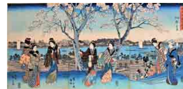
江戸文化の跡・隅田川堤の花見

会場：5階 研修室1 定員：50人（抽選） 受講料：1,500円（初日会場でお支払いください） 申込：往復ハガキ、8/20(日) 必着 申込先・お問い合わせは右記をご覧ください。 申込方法→往復ハガキに住所・氏名(フリガナ)・電話番号・「近世江戸歴史入門」を明記の上、下記へ郵送。連名可。 〈郵送先〉〒120-0034 足立区千住5-13-5 生涯学習センター内 あだち区民大学塾事務局 〈問合せ〉03-5813-3759 平日午後1時～5時