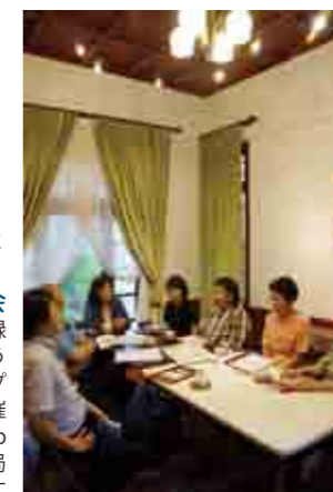
洋館で開かれる読書会

縁側カフェ 営業時間：午前11時30分～午後6時 (ラストオーダー 午後5時30分) お休み：土、日、月 東京都足立区西保木間2-5-10 TEL. 03-3883-0011 http://www.shouwanoie.jp 竹ノ塚駅東口より徒歩…14分 東武バス停「西保木間2丁目」下車