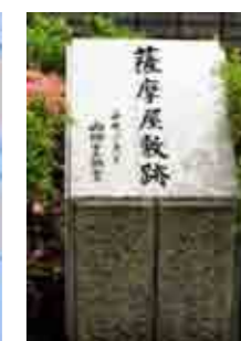
幕末動乱の跡 薩摩屋敷跡