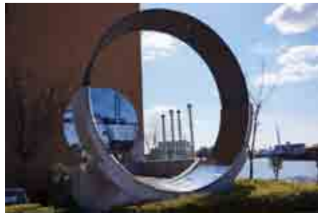
お化け煙突モニュメント