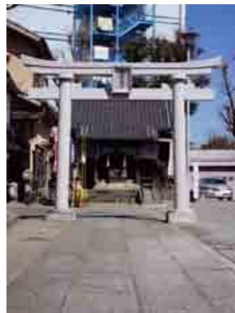
寿老人の像がある元宿神社