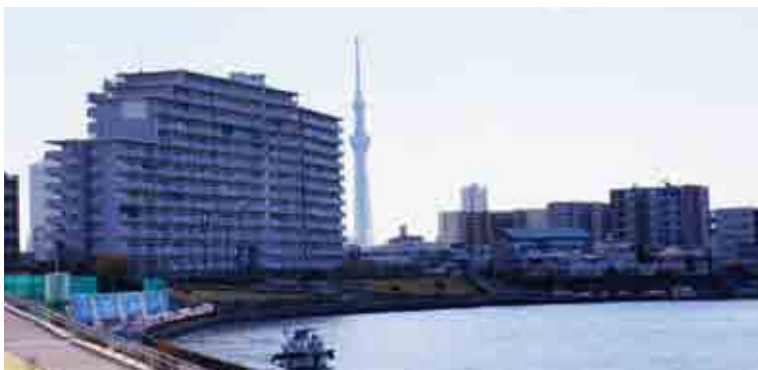
隅田川とスカイツリー