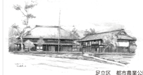
足立区 都市農業公園

足立の風景の見どころを紹介し、街並みを題材にして、スケッチの手法を学びます。また、実際にスケッチに出かけ、足立の風景を自分の作品として画用紙に残します。