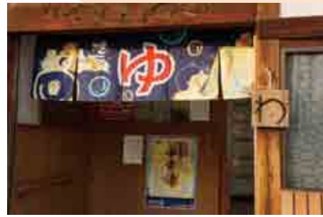
タカラ湯の入口に「わ」の下げ札