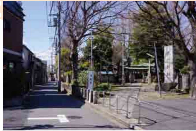
千住大川町氷川神社と路地