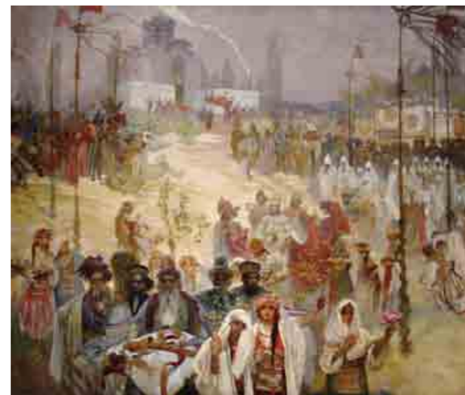
《スラヴ叙事詩「東ローマ皇帝として戴冠するセルビア皇帝ステファン・ドゥシャン」》 → 1923年 プラハ市立美術館

ミュシャ展 2017. 3/8(水)～6/5(月) 休館日：毎週火曜日 (ただし、5/2[火]は開館) 開館時間：午前10時～午後6時 *入場は閉館の30分前まで 毎週金曜日、 4/29[土]～5/7[日]は 午後8時まで 会場：国立新美術館 企画展示室2E