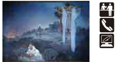
《スラヴ叙事詩「原故郷のスラヴ民族」》1912年 プラハ市立美術館

3月8日(水)～6月5日(月)、国立新美術館で開催の「ミュシャ展」の関連文化講演会です。アール・ヌーヴォーを代表する芸術家、ミュシャが晩年故郷に戻り約16年間を捧げた渾身の大作《スラヴ叙事詩》を手がけました。チェコ国外で初めて全20点公開する同展の見どころを中心に、アール・ヌーヴォー時代から晩年まで、画業を辿ります。講座参加者お一人1枚、招待券を差し上げます。