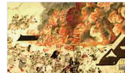
「三条殿の夜討」 『平治物語絵巻』 模写(寛政10年) ボストン美術館蔵

中世には多くの絵巻物が作成されました。古代から中世にかけては、天皇・貴族から武士を中心とした社会へ移行しました。こうした時代の大きな変革の中で絵巻物が作成された意義を考えていくことで中世社会が見えてきます。絵巻物や文献史料から総合的に考察しながら、中世の戦のあり方や信仰について考えていきます。