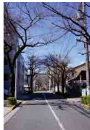
元宿神社前の桜並木