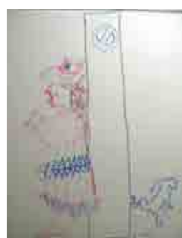
カルマンタのいたずら書き

今年も五月にアンデス音楽の「カルマンタ」が生涯学習センターにやってきました。4人の素晴らしい歌声と民楽の演奏をお楽しみいただけます。 アンデス音楽はボリビア・ペルー・エクアドルなどアンデス諸国の先住民の音楽とスペイン系の音楽が融合して生まれたものです。使われる楽器はスペインに起源を持つギターやチャランゴ（スペインの昔のギターが南米化した楽器。ギターより高音部が高く哀愁を帯びた音色）、先住民の管楽器ケーナ（竹や葦を素材にした古くから伝わる縦笛）やサンポーニャ（葦を素材にしたアンデスのパンフルート）、そして打楽器のボンボ（大木の幹をくりぬき胴に使い、子牛、山羊などの鞆していない皮を両面に張った太鼓）などです。コンサートではこれらの楽器のリズミカルな演奏に思わず踊りだすお客さまもいらっしゃいます。