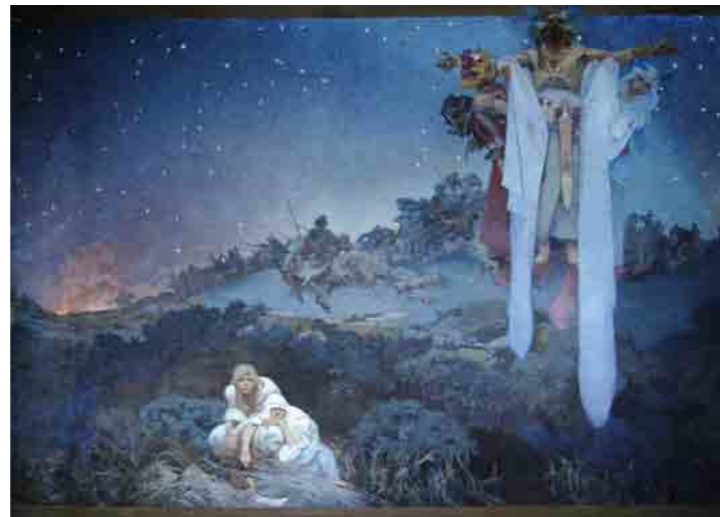
↑《スラヴ叙事詩「原故郷のスラヴ民族」》 1912年 プラハ市立美術館