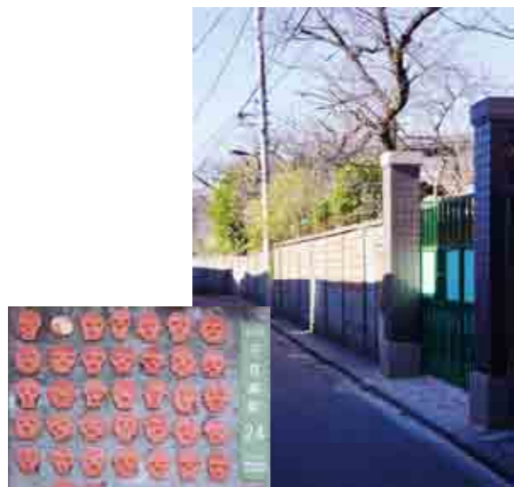
園児たちが作ったお面が路地の塀に続いています