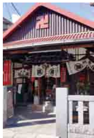
千寿双葉小の隣 千宝山新橋霊場地蔵尊