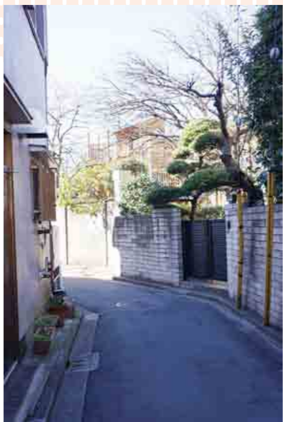
道は何度も緩やかに曲がっていきます