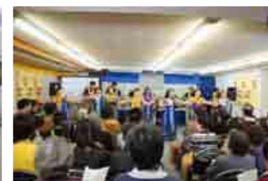
ふれあいコンサート風景