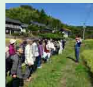
無農薬栽培のお米