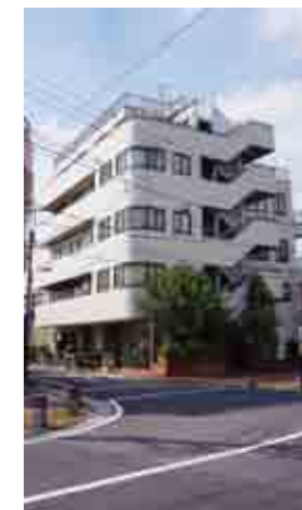
江北美術展の会場となる木村ビル