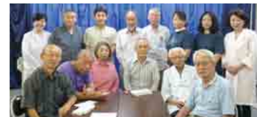
「江北美術展ふれあいくらぶ」のみなさん