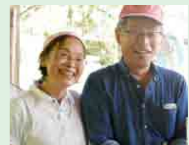
昼食をもてなしてくださった農家のご夫妻

生涯学習センターで活躍するボランティアの交流研修会として、埴町(福島県東白川郡)へのバスツアーを実施しました。 訪問先の埴町では、東日本大震災から五年半が過ぎた今も、放射能による風評が農産物や観光などに影響しています。現地では米放射線検査場の見学、カボチャの収穫体験、地元のお米や野菜を使った昼食、ダリア園の見学、道の駅での買い物などたくさんの方の体験と交流ができました。 米放射線検査場では高価な検査機器を導入、検査の基準となる数値も大変低い数値を設定するなど厳しくチェックしており、埴町のお米は大丈夫!と確信しました。「百聞は一見にしかず」ですね。(農産物も他の場所で同様の検査を行っているということでした) そして澄みわたる青空と緑に囲まれ