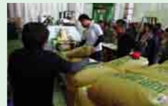
米の放射線検査場

今年で八回目を迎えた「あだちサークルフェア」は二日間ともあいにくの雨でしたが延べ二万五千人を超えるお客様にいらしていただきました。若さあふれるダンスから熟練の舞踊、繊細で美しい展示物と多くの方にご満足いただけたと思います。 ナマガくんがお出迎えする一階ウェルカムランドでバルーンアートや健康チェック、四階わくわくランドでは輪投げや玉入れゲームが行われました。五階の体験ランドでは科学実験、カレンダー作り、鉄道ジオラマ、紙相撲千住場所なども人気でした。有名テーマパークのチケットが当たる抽選会にも多くの方が並ばれていました。 今年も一円玉アート募金にご協力ありがとうございました。おかげさまで五千五百二十円が集まりました。