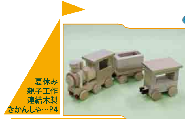
夏休み 親子工作 連結木製 きかんしゃ…P4