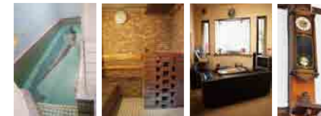
子どもプール サウナ(別料金) 休憩所 柱時計