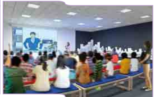
大人の 仕事体験 きみも 新聞記者に なろう…P4