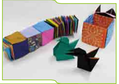
脳を育てる! 親子で楽しむ 折り紙教室…P4