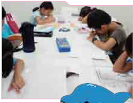
書ける 身につく 読書感想文 教室A・B…P4

夏休み! 涼しい「子どもフリースペース」 7月21日(木)～8月24日(水) 開設…P1