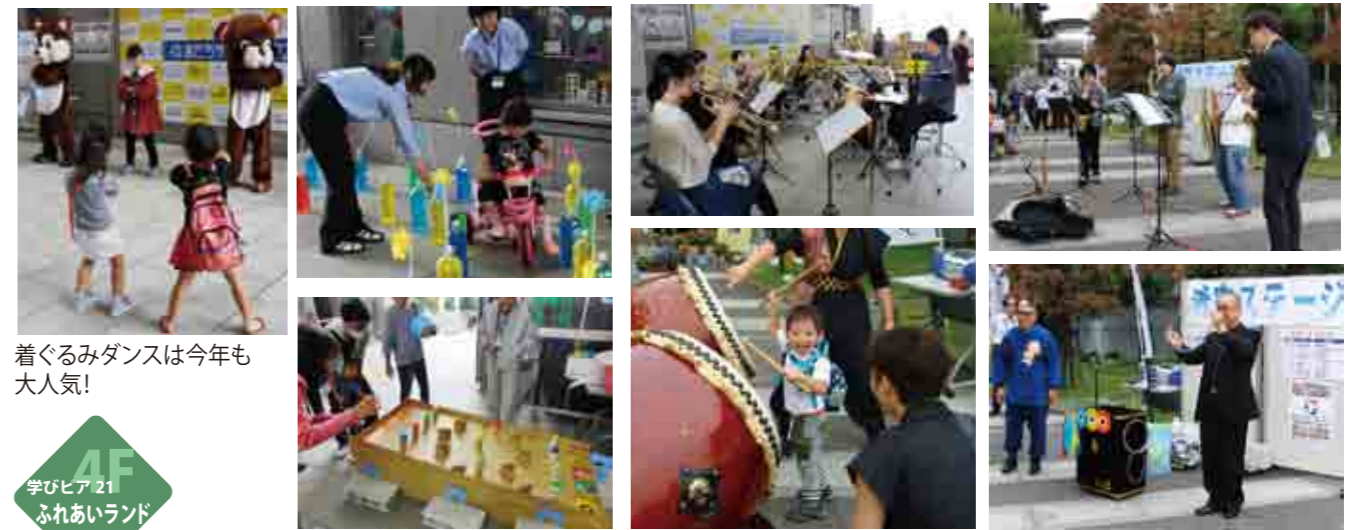
着ぐるみダンスは今年も大人気!