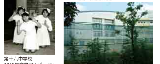
第十六中学校 1968年卒業アルバムより学校祭