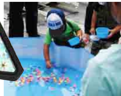
カップいっぱいのスーパーボールに得意顔