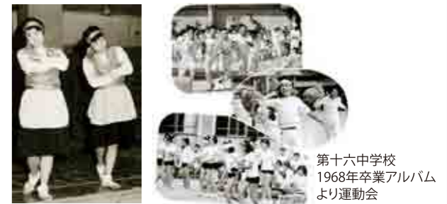
第十六中学校 1968年卒業アルバムより運動会