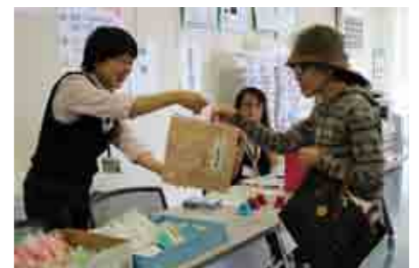
抽選会場には多くのお客様がいらっしゃいました。