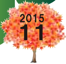
世界のSHOW 舞踊と音楽