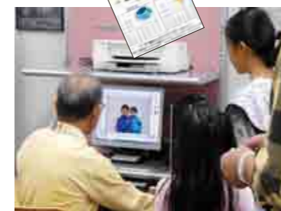
親子や兄弟の写真が入ったカレンダーづくり。