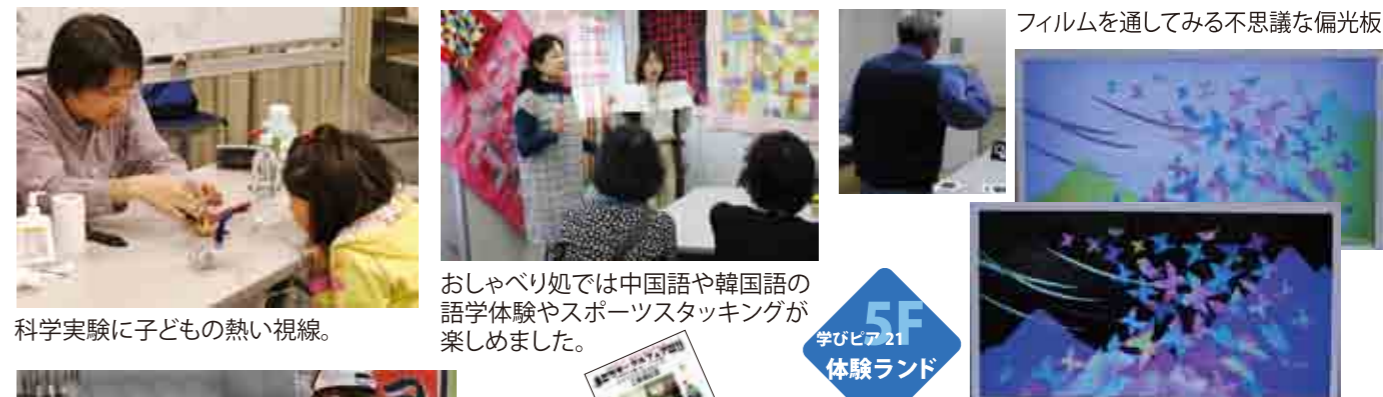
科学実験に子どもの熱い視線。

イライラ三輪車とコリントゲーム 青空ステージはマジックやミニコンサート、太鼓体験も楽しめました。単純だけどハマってしまう。