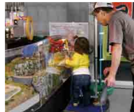
鉄道ジオラマには子どもも大人も夢中です。