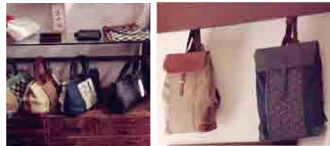
東京都足立区千住四丁目4-12-3 web http://watanabebags.jp

「形見の着物を鞆として生まれ変わらせたい」「百年以上も前の帯だけど、鞆として使いたい」「鹿害で駆除された野生のシカを商品化したい」といったお客様のさまざまなご要望を受けながら、世界に一つだけの鞆を作り続けています。