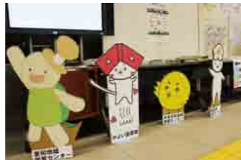
地域学習センターや図書館のキャラクターがお出迎え