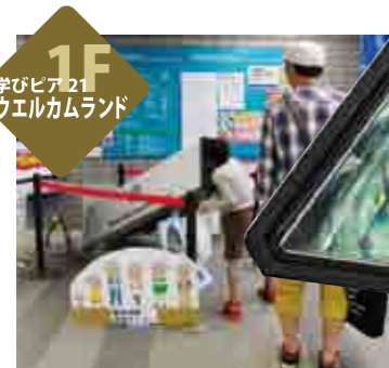
顔がすっぽり入ってしまうような巨大万華鏡