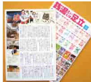
「銭湯といえば足立」(発行:東京都公衆浴場業生活衛生同業組合足立支部)で足立区の銭湯のレポートを連載。