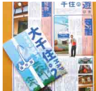
足立区発行の大千住 MAP PART 2 でも千住の銭湯や飲み屋などの紹介に役買っています。