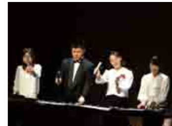
トーンチャイムの柔らかな音色。会場のみんなも触って鳴らしました。