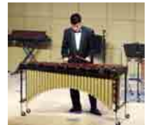
マリンバの演奏。素早いバチの動きにビックリ。